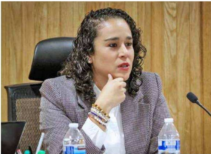
Amalia Pulido, presidenta del Instituto Electoral Mexiquense.

Amalia Pulido destacó que tras la entrega de los expedientes el pasado viernes, se llevó a cabo un proceso de captura por parte de la Dirección de Partidos Políticos, que concluyó en la madrugada del domingo.