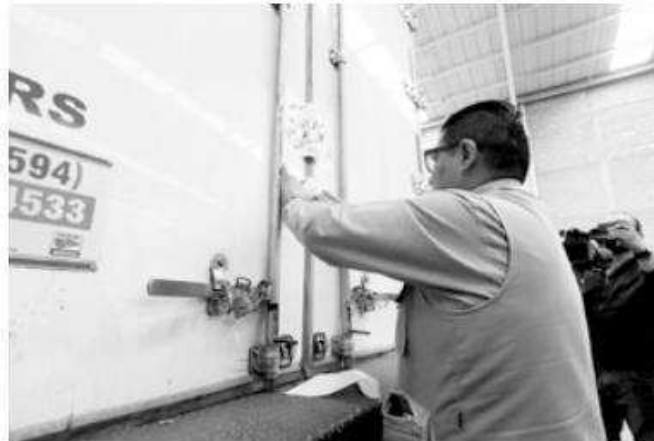
Fueron entregadas 90 cajas de material electoral.

Este monumental despliegue se llevará a cabo a lo largo de 62 rutas, con el respaldo de 73 vehículos cus-