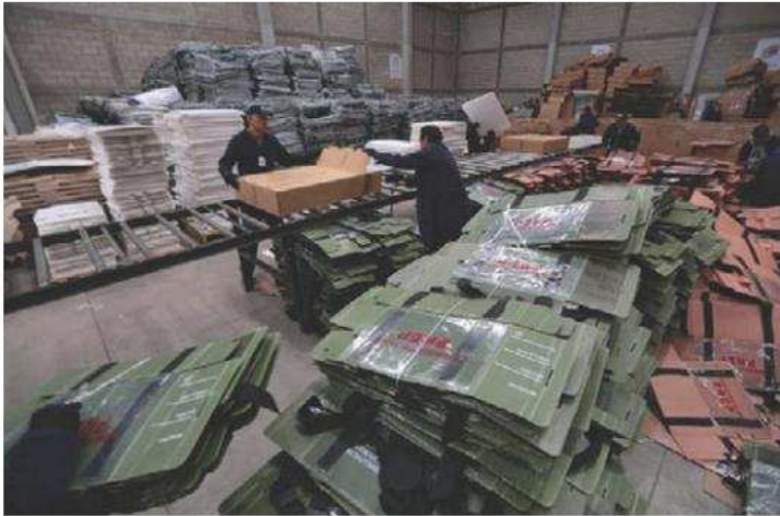
Los trabajos iniciaron en los almacenes. TANIA CONTRERAS