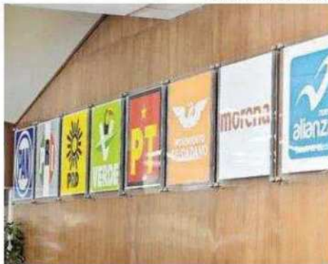
Esperan sesionar el próximo jueves por la noche

"Les puedo comentar que un 20% de los expedientes estaban completos y en el otro 80% hay algunos faltantes, en estos requerimientos incluyen esos faltantes. Los partidos tienen 48 horas para subsanar y emitir estos faltantes.