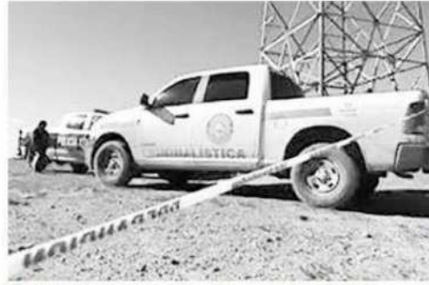
En México 17 personas precandidatas y candidatas a algún cargo de elección han sido asesinadas.