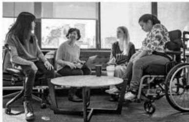
Los partidos políticos deberán cumplir con la representación de grupos indígenas y personas con discapacidad.

Con miras a la elección del 2 de junio, donde se disputarán mil 300 cargos entre diputaciones locales y ayuntamientos, se establecen medidas de inclusión para garantizar la representación de grupos históricamente marginados. Los partidos políticos deberán cumplir con un porcentaje obligatorio de representación de cuatro grupos: indígenas,